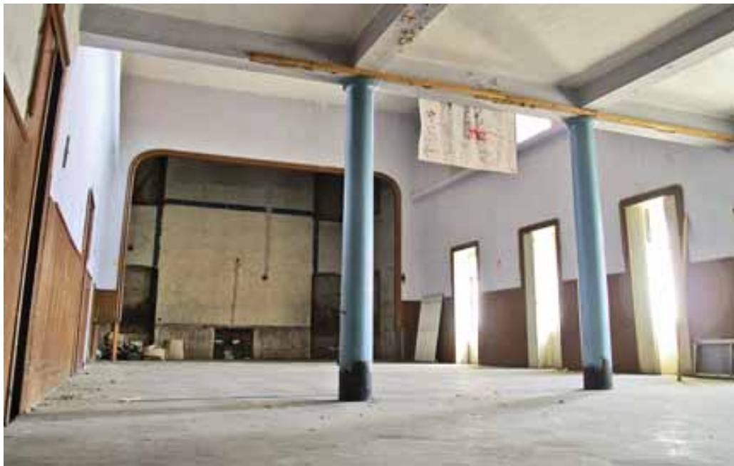
Dvorana v Narodnem domu, nekdanje prvovrstno mestno družabno središče, že desetletja sameva, društvene dejavnosti pa zaman iščejo primerne prostore za svoje udejstvovanje