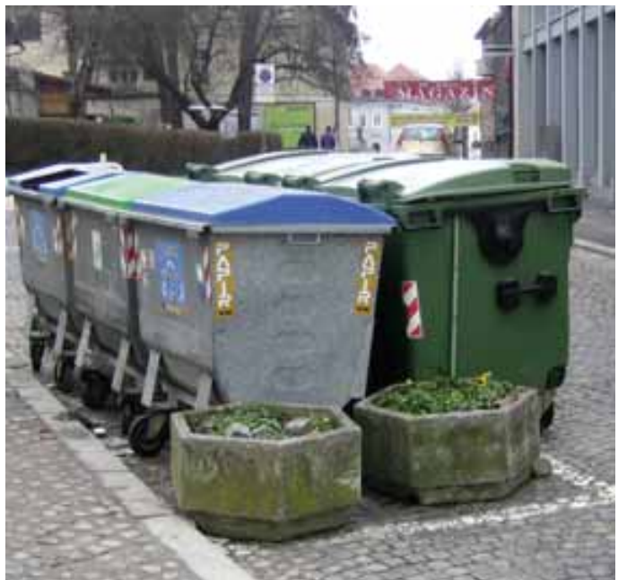
Ena od posebnih novomeških »urejenosti« so tudi smetnjaki sredi glavne mestne prometnice