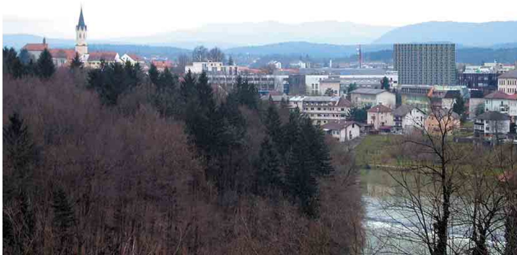
Takole bi bila videti panorama mesta z nebotičnikom s severa (fotomontaža)