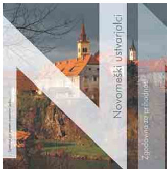
Novomeški ustvarjalci - zgodovina za prihodnost

Tema, ki se v vsem tem času ni premaknila z mrtve točke oziroma je celo nazadovala, je prav gotovo urejenost mesta in njegova podoba. Prizadevanja Društva Novo mesto od pogovornih večerov (urejenost