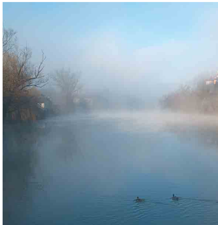
NAD MESTOM SE DANI ... Megla se dviga in napoveduje župana tudi novomeško štiriletje tako vedro?

Evropska komisija je zaradi slabe kakovosti zraka v naših mestih pred kratkim vložila tožbo proti Sloveniji. Evropska strategija namreč govori o trajnostnih mestih, kar po eni strani pomeni zmanjšanje prometa in izpušnih plinov v urbaniziranih območjih, po drugi strani pa uporabo zelene energije in povečanje zelenih površin v mestnih okoljih. Torej je eden od glavnih vzrokov za onesnažen zrak v naših mestih slabo vodena