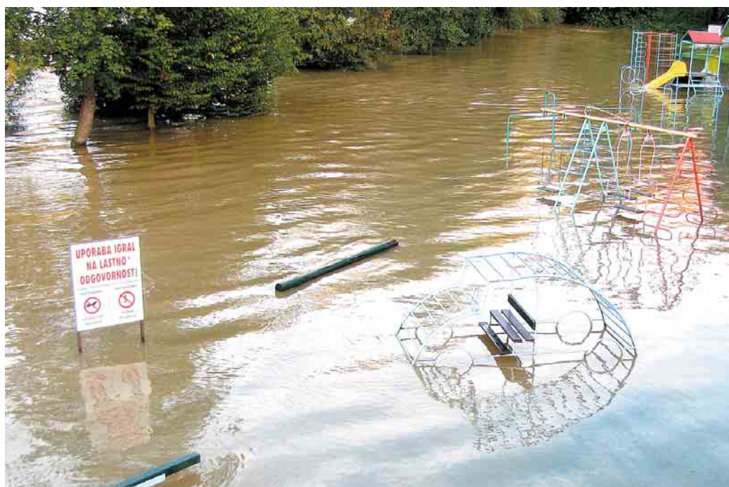
UPORABA IGRAL NA LASTNO ODGOVORNOST! Ob zadnji poplavi je tudi Krka spet pokazala zobe: v parku Evropske skupnosti na Seidlovem travniku v Novem mestu je do kolen zalila otroško igrišče. Sicer tukaj ni naredila posebne škode, s čolnom se pa tudi ni nihče priplul igrat