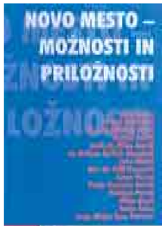
Naslovna stran Zbornika