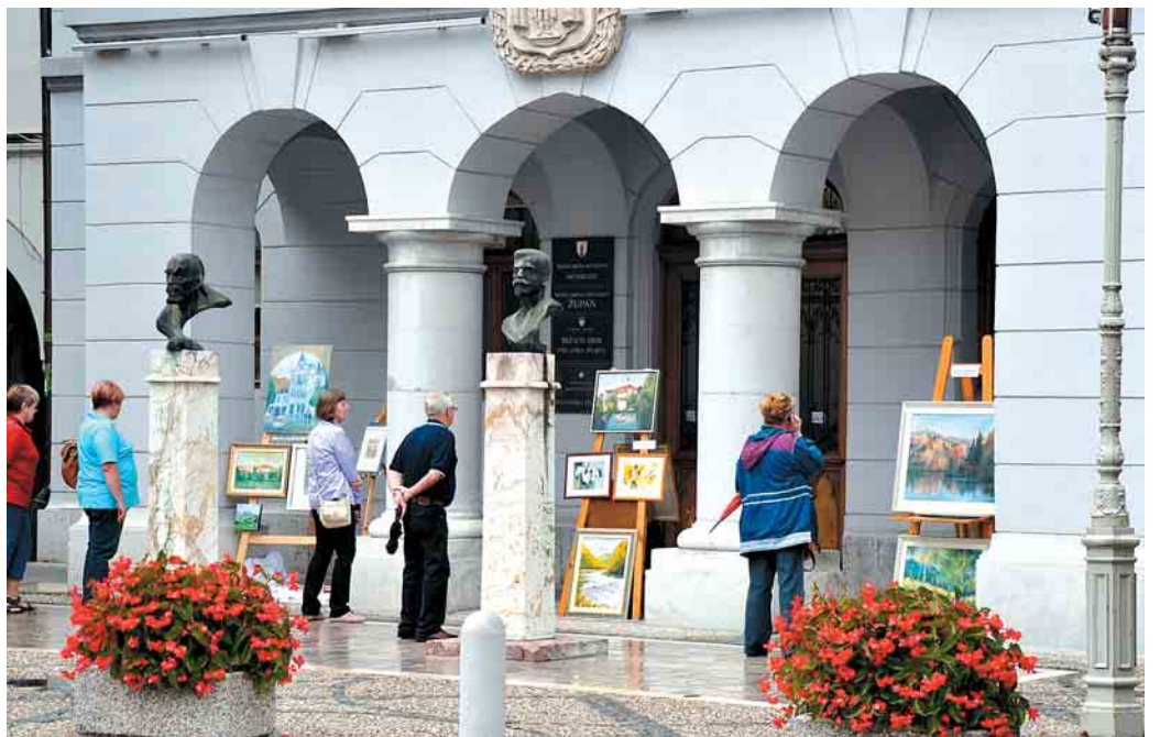
Takole so se umetniki predstavili občinstvu konec avgusta

V od boga in občine zapuščeno spomeniško poslopje, ki je kazalo samo še rebra in razbite šipe, so se vselili mladi alternativci, ki slikajo in improvizirajo na ves glas. Za varnost pa bo vseeno morala poskrbeti občinska oblast, ki si je do zdaj samo ušesa zatiskala.