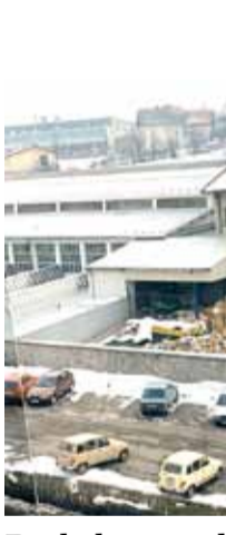
Pogled na posl