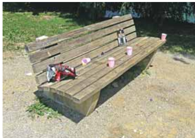
Na klopeh v parkih na bi se sedelo, ne pa »tam, kjer svinja leži...«