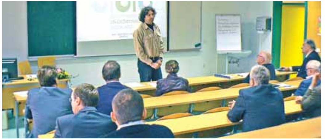
V skrbi za razvoj Univerze v Novem mestu je pred leti na pobudo Društva Novo mesto nastalo društvo Dolenjska akademska pobuda – zato ob vsakem zboru članov spregovori nekaj spodbudnih besed tudi predsednik našega društva