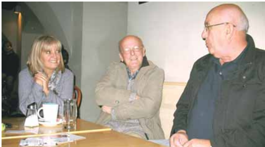
Nekateri zvesti udje Društva ne zamudijo nobene priložnosti, da ne bi povedali svojega mnenja o usodi dolenjske prestolnice