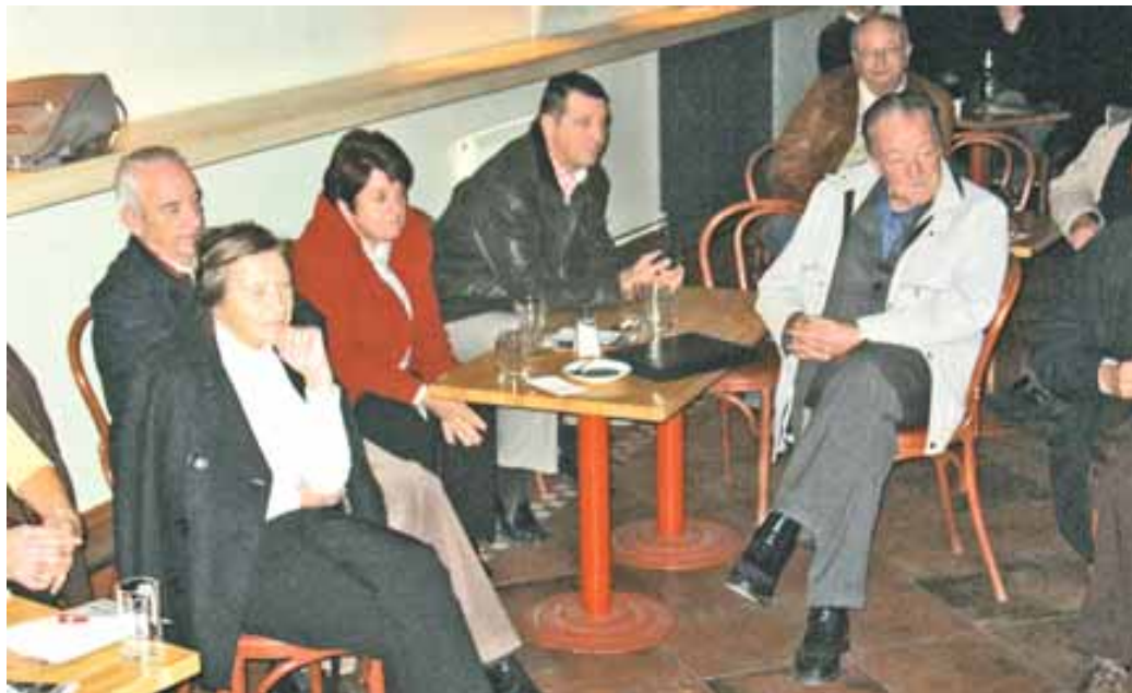
Društvenega pogovornega večera o tem, kakšnega župana si Novomeščani želimo, se je v klubu LokalPatriot udeležilo presentljivo število razpravljavcev