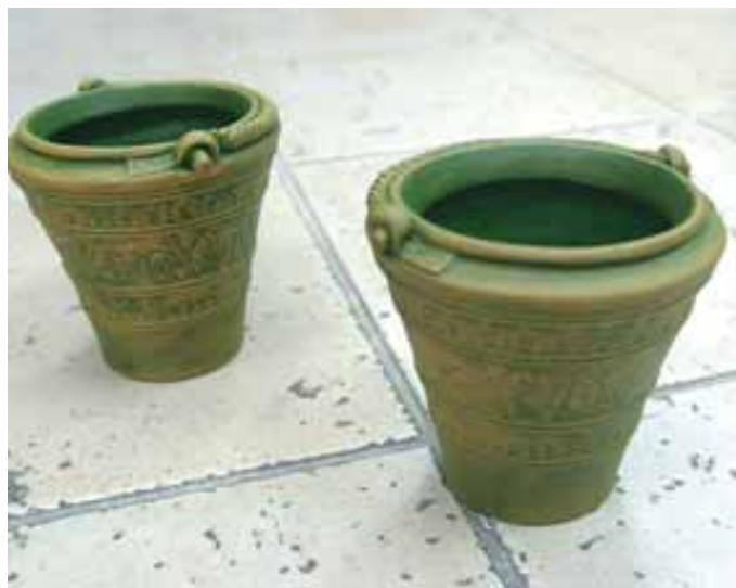
Mesto situl premore polovico vseh halštatskih vedric, kolikor so jih do zdaj izkopali v Sloveniji – replike teh situl so nedvomno zanimivi izdelki