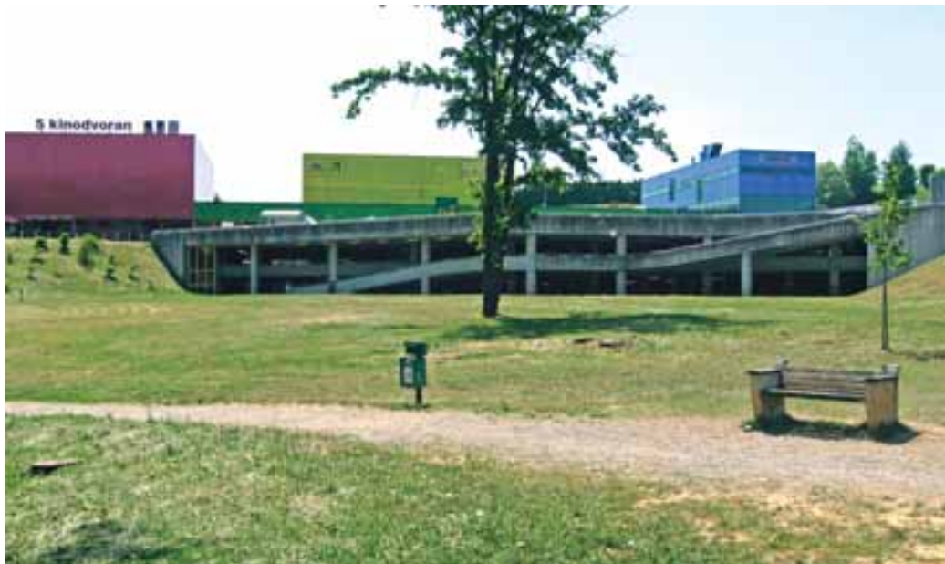
Pučavsko zanemarjen travnik pod Tuševim nakupovalnim središčem, bi si vsaj v poletni suši zaslužil kakšno osvežilno tuširanje