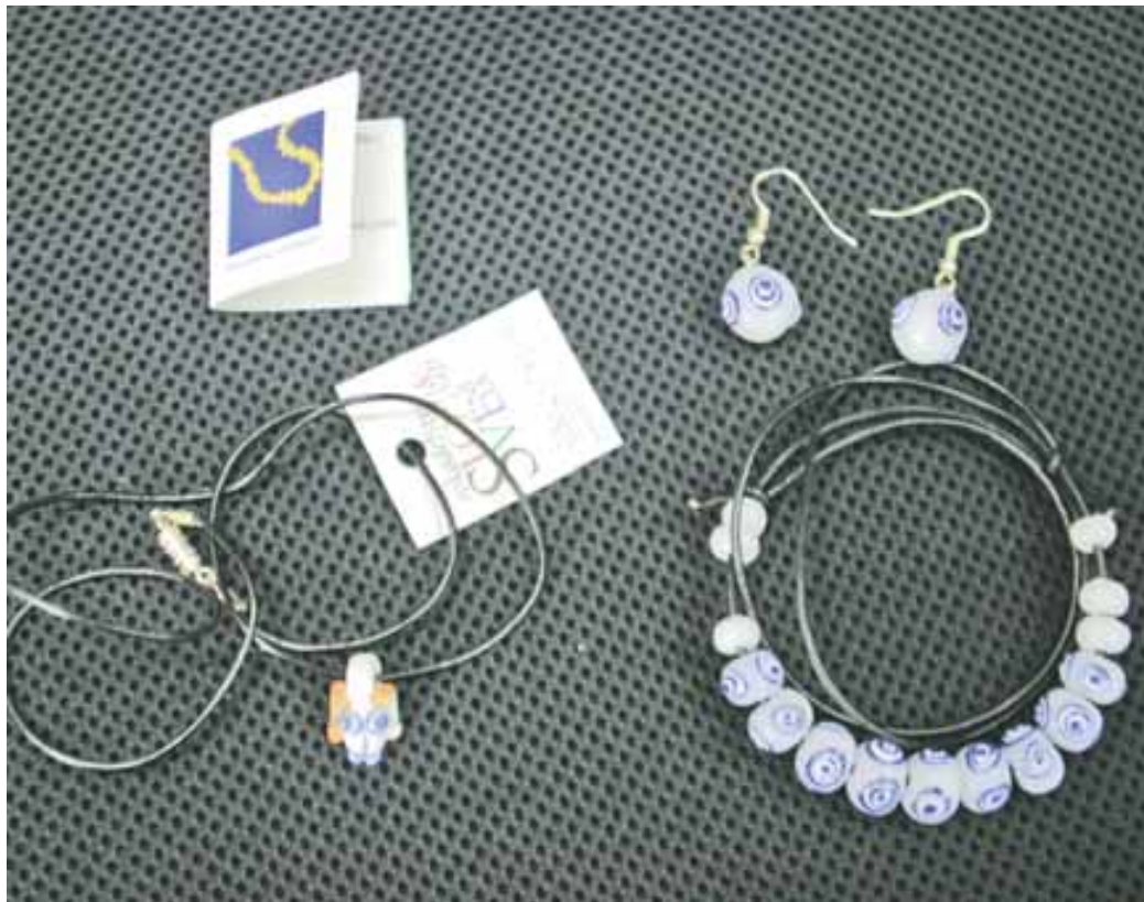
Arheološke najdbe iz novomeškega halštata so zanesljivo najpomembnejša dolenska kulturna dediščina – v Dolenjskem muzeju in v Turističnem informacijskem centru na Glavnem trgu v Novem mestu boste našli pestro izbiro spominkov in daril