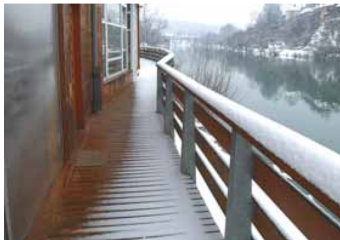
Ko pride zima (zgoraj) in natrosi nekaj centimetrov snega, je ožina na Kandijski cesti mimo slovitga »vagona«, ki v sramoto nekdanjim novomeškim oblastnikom čepi med Krko in cestiščem, bolj

podobna vaški stezici, na kateri lahko pešci vsak trenutek uživajo v izdatnih pljuskih umazane »plojdre« izpod koles mimovozečih plehnatih kočij. Ne samo, da vagon zapira pogled na slikovito panoramo srednjeveškega Brega, njegov lastnik nezakonito zapira tudi prehod po mostovžu nad Krko, ki bi vsaj ob sneženi brozgi lahko rešil pešce pred neprijetno ploho