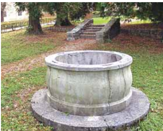
Vodnjak v grmskem grajskem parku