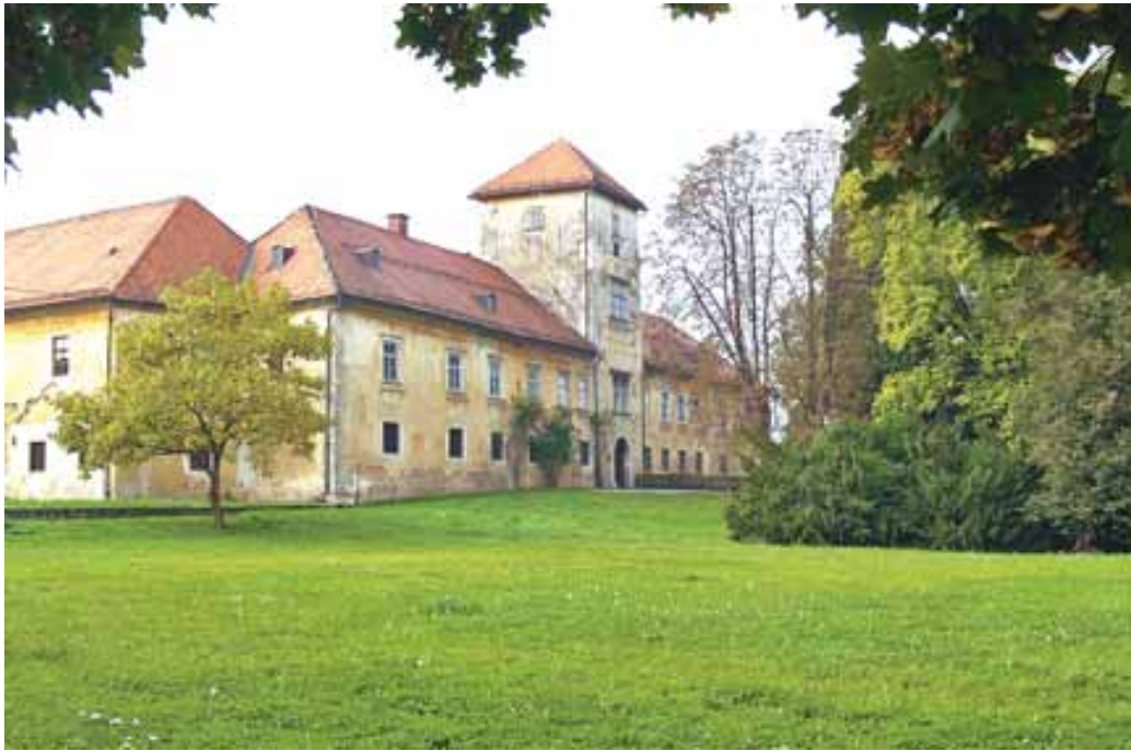
Grmsko grajsko poslopje je najbolj podobno pravemu srednjeveškemu gradu v našem mestu