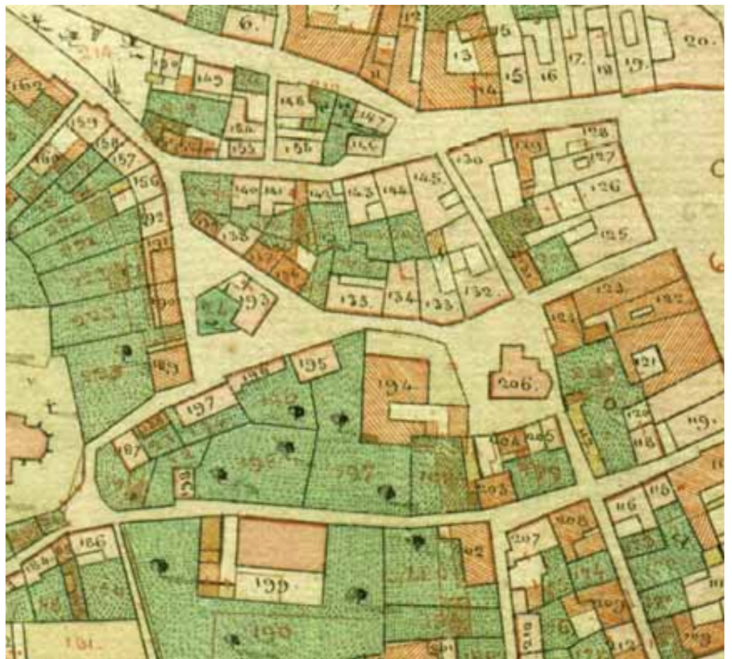
Središče starega mestnega jedra po franciscejskem katastru iz leta 1825. Trikotni sklop ulic pod Kapitljem, sredi katerega je cvetela gostilna (številka 193) je bil osrednji mestni trg, na današnjem Florjanovem trgu, ki je dobil pozneje ime po cerkvi sv. Florijana (številka 206), pa je še prej stala cerkvice »Svetega Antona v gozdu«

Upoštevala je tudi dejstvo, da je mesto prostor, v katerem se nenehno dogajajo spremembe, in če želimo razumeti sedanje dogajanje