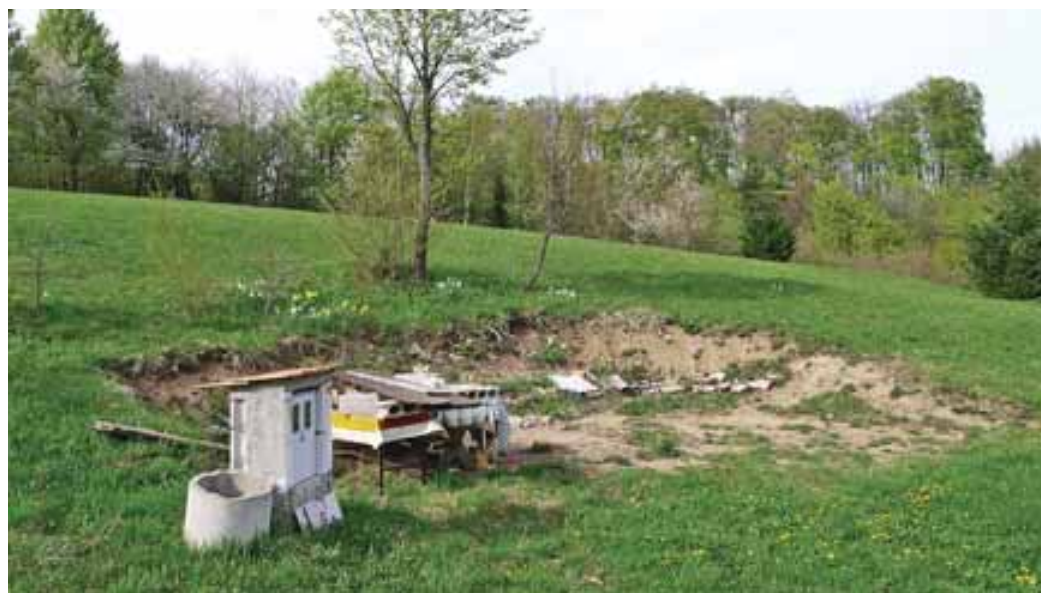
Izkop, nekaj gradbenih elementov in omarica za elektriko napovedujejo rešnega stavbenika