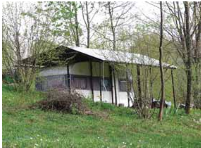
Mar za takle »objekt« na Gorjancih ni treba gradbenega dovoljenja?