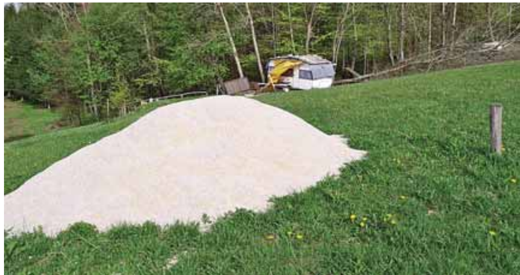
Količek in nekaj kubikov peska sredi košenice sporočajo, da se bo tukaj najbrž zidalo...