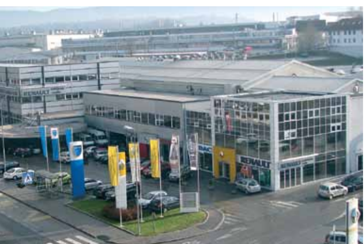
in servis TPV avto danes