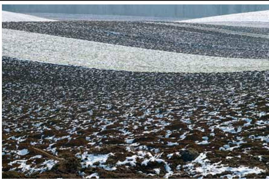
Njive v snegu, Otočec