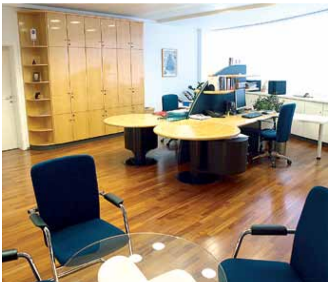
Notranja oprema pisarn v TPV