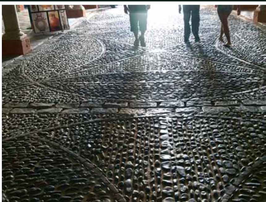
Ulica v Cordobi, Španija 2010