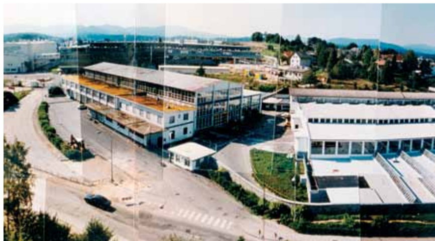
Pogled na Karlovško cesto in upravno stavbo IMV nekdanj

h) Vsa drevesa na dvorišču bivšega hotela Kandija je treba ohraniti in urediti park na notranjem kareju med Resslerovo in Trdinovo ulico.