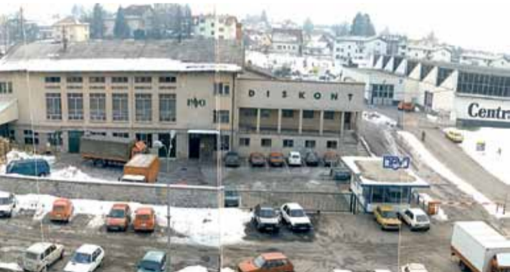
Opnja TPV nekdanj