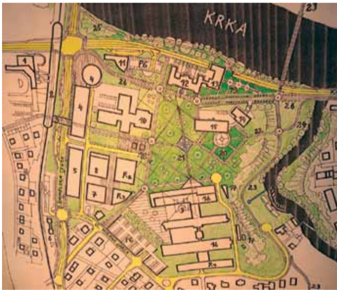
Študija bolnišničnega kompleksa, 2004