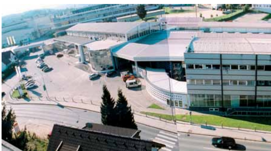
Pogled na upravno stavbo TPV danes