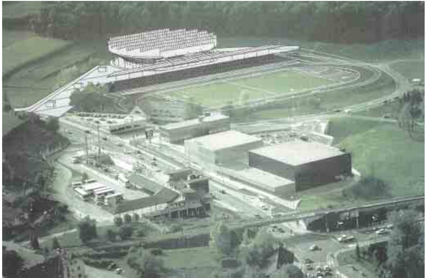
Študija umestitve mestne večnamenske dvorane v športno-rekreacijskem parku Portoval iz leta 2003 (dvorana in pokrite tribune v zgornjem delu slike nad stadionom) – iz gradiva na novinarski konferenci 28. januarja 2011

Društvo Novo mesto niti ne gradi, niti ne ruši, saj za kaj takega nima ne denarja ne moči, lahko pa opozarja, če drugi tega ne počno po zdravi pameti.