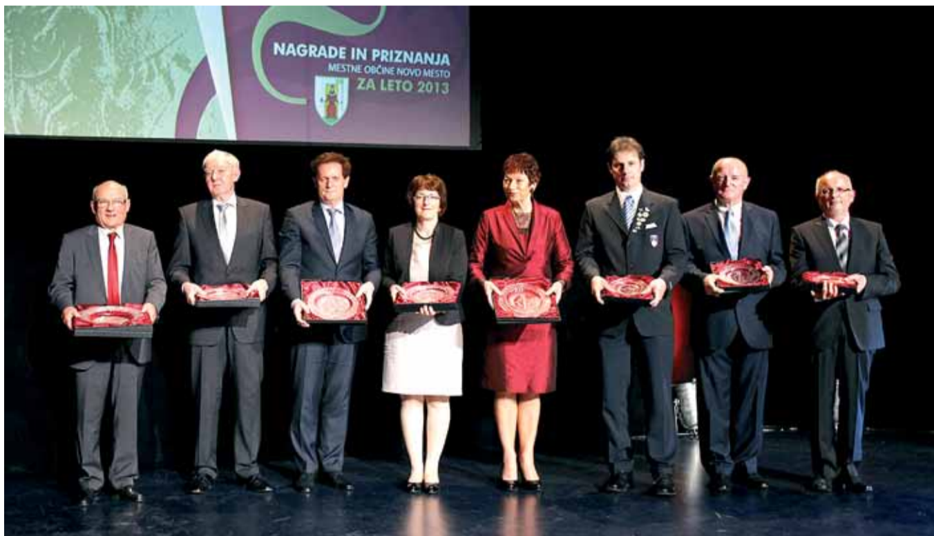
Nagrejence smo predstavili v stolpcu z grbom desno od slike

REDNI LETNI ZBOR ČLANOV DRUŠTVA NOVO MESTO